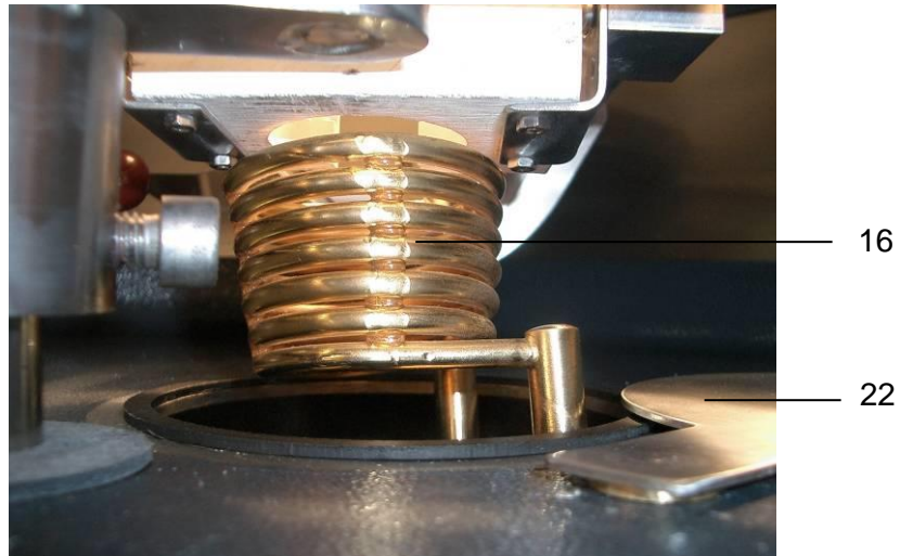
Abb.: Innenraum mit Induktionspule